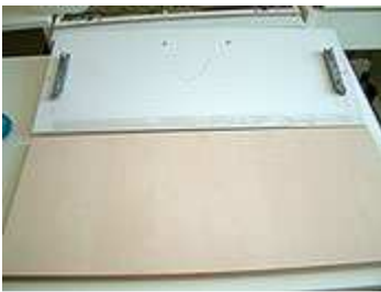
Übertragen der Bohrlochpositionen auf die neue Front