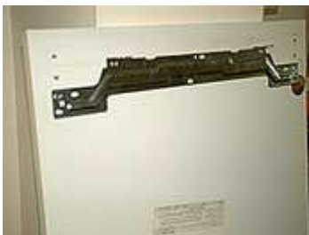
Alte Kühlschrankfront mit Halterung