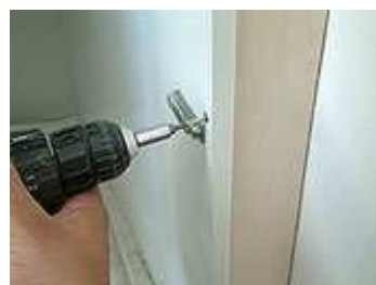
Festschrauben einer neuen Wandblende durch vorhandene Bohrlöcher