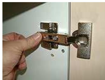
Türen in korpusseitige Grundplatten einclippen