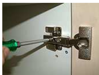
Tür: Tiefenverstellung (vor - zurück)