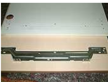
Neue Kühlschrankfront mit alter Halterung