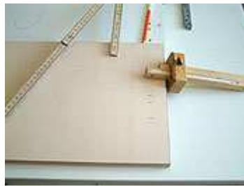
Exaktes anreißen, evtl. Vorbohren der Schraublöcher