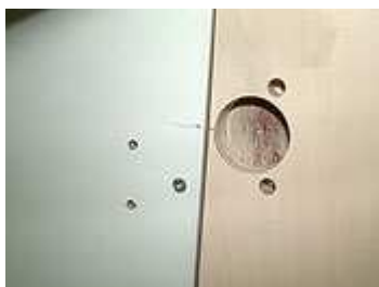
Topfbandposition an Korpuskante anzeichnen