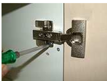
Tür: Höhenverstellung (auf - ab)