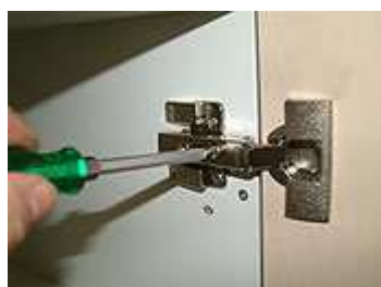
Tür: Seitenverstellung (links - rechts)