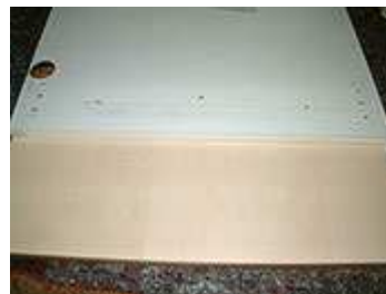
Vorbohren der Befestigungslöcher