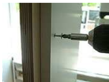
Befestigung einer neuen Frontblende an einem vorhandenen Apothekerauszug