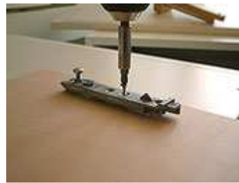
Anbringen der alten Fronthalterungen auf der neuen Front

Die dargestellten Fronthalterungen sind natürlich nur ein Beispiel von mehreren sich auf dem Markt befindlichen Modellen.