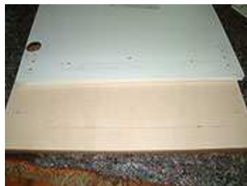
Übertragen der Bohrlochpositionen auf die neue Front