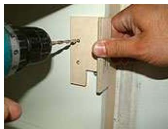
Befestigungslöcher für Grundplatten mit einem 5 mm Bohrer bohren